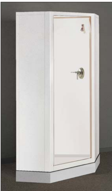
Model #48: Corner Shower (Not exactly as shown) Modèle N° 48 : douche de coin

NOTA : Les cabines d'une couleur autre que le blanc et le plancher de terrazzo fait de morceaux de marbre de couleurs autres que le blanc et le noir sont offerts sur commande. Communiquer avec notre Service d'aide à la clientèle pour les détails.