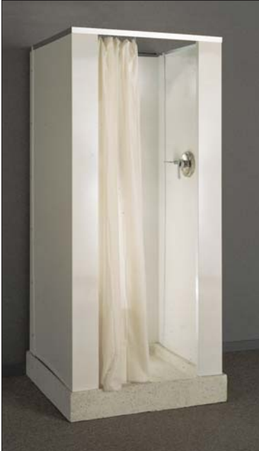
Model #47 Modèle N° 47

A handsome shower cabinet made of No. 22 heavy gauge galvanized-bonderized steel. The inside and outside are finished with baked-on white enamel. All interior corner joints are rounded for interior aesthetics and fit flush against wall surface. The door entrance includes stiles, headrails and threshold in one hollow metal piece for easy installation. The Cadet comes complete with soap dish, a heavy plastic curtain, integral rod and curtain hooks.